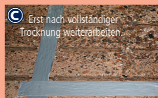
C Erst nach vollständiger Trocknung weiterarbeiten