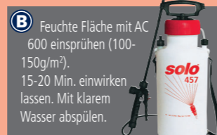
B Feuchte Fläche mit AC 600 einsprühen (100-150g/m 2 ). 15-20 Min. einwirken lassen. Mit klarem Wasser abspülen.